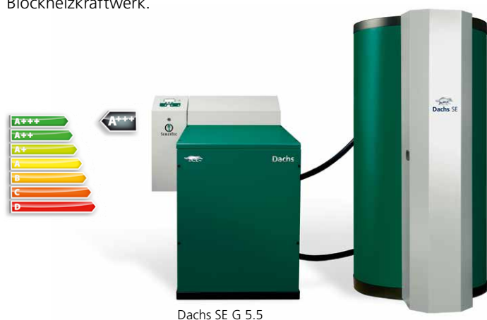
Dachs SE G 5.5

Für die Versorgung von Mehrfamilienhäuser ab 3 Wohneinheiten eignet sich der Dachs ideal. Sie erzeugen bis zu 70 Prozent des Stroms und 90 Prozent der Wärme verbrauchsnahe und nahezu verlustfrei im Objekt selbst. Der Dachs Pro 20 mit 19,2 kW elektrischer und 42 kW thermischer Leistung eignet sich vor allem zur Deckung des Grundbedarfs von ganzen Wohnkomplexen, Hochhäusern und großen Mehrfamilienhäusern. Beide Systeme lassen sich in jedes Heizungssystem integrieren und liefern intelligent und komfortabel Strom und Wärme für die Mieter bzw. Eigentümer. Bereits mehr als 35.000 zufriedene Kunden vertrauen auf den Dachs. Der Dachs ist damit Europas meistverkauftes Blockheizkraftwerk.