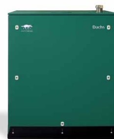
Dachs Pro 20